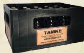
KÖNIGSBRÜCKER Kasino Pilsner