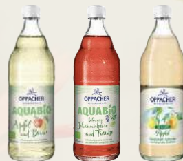
OPPACHER Aquabio und Direktsaftchorlen - verschiedene Sorten