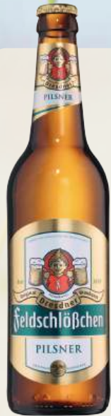
FELDSCHLÖßCHEN Verschiedene Sorten