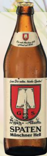
SPATEN Münchner Hell